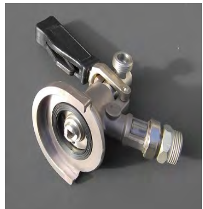
KEG – Zapfkopf Kombifitting