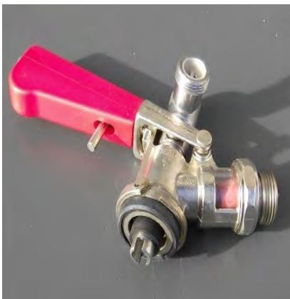
KEG – Zapfkopf Korbfitting

Mietpreis langes Wochenende 24 € plus Kohlensäure 10,50 €