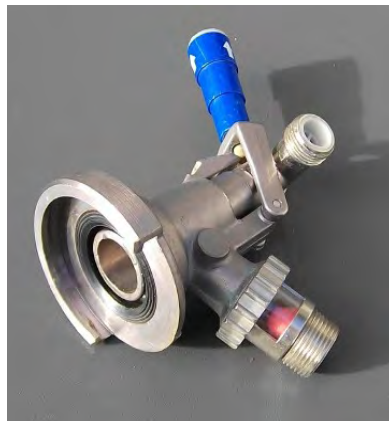
KEG – Zapfkopf Flachfitting